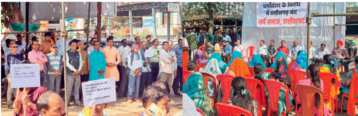
हरिभूमि न्यूज ►► बलौदाबाजार

सर्व समाज के आह्वान पर छत्तीसगढ़ बंद का बलौदाबाजार में व्यापक और स्वतःस्फूर्त असर देखने को मिला। नगर के प्रमुख बाजार एवं व्यावसायिक प्रतिष्ठान बंद रहे और आम जनजीवन पर बंद का स्पष्ट प्रभाव दिखाई दिया।