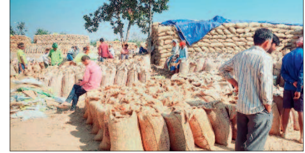
हरिभूमि न्यूज ►► बिलाईगढ़

धान खरीदी केन्द्र धनसीर में इस खरीफ सीजन में धान की बम्पर आवक दर्ज की जा रही है। केन्द्र में अब तक कुल 23,244 क्विंटल 80 किलो धान की खरीदी की जा चुकी है, लेकिन अपेक्षित गति से उठाव नहीं होने के कारण समिति की चिंताएं बढ़ती जा रही हैं। प्राप्त जानकारी के अनुसार अब तक मात्र