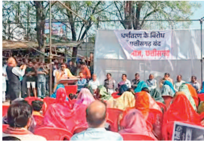
हरिभूमि न्यूज ►► बलौदाबाजार

इसी क्रम में दोपहर 12 बजे बलौदाबाजार के बजरंग चौक से आक्रोश रैली का आयोजन किया गया। रैली में बड़ी संख्या में गणमान्य नागरिकों, युवाओं, मातृशक्ति एवं जनप्रतिनिधियों की सहभागिता रही। रैली के दौरान आमावेड़ा एवं नारायणपुर की घटनाओं के विरोध के साथ-साथ धर्मांतरण के खिलाफ जोरदार